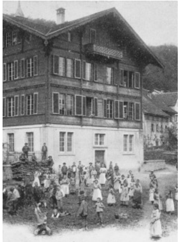
Das Direktionsgebäude der «Schappe» wird nach dem Brand des Gasthofs Zum schwarzen Adler von den Büttenern ins Dorf verlegt und dient am Standort der heutigen Gemeindeverwaltung ab 1883 als neues Schulhaus.

Informationen und Anmeldung: Doris Gitzi, Telefon 061 741 23 27 spielgruppe.schildchroetli@bluewin.ch Facebook: Spielgruppe Schildchrottli www.spielgruppeschildchroetli.jimdo.com