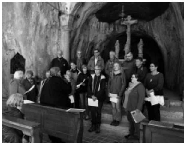
Reise nach Solothurn, 2014