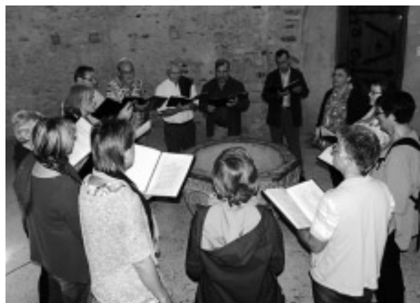
Reise nach Thun, 2014