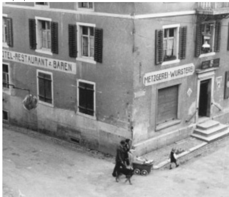
Die enge Strassenkreuzung «Bäräegge» beim Hotel Bären in den 1940er-Jahren, heute Coop-Supermarkt.