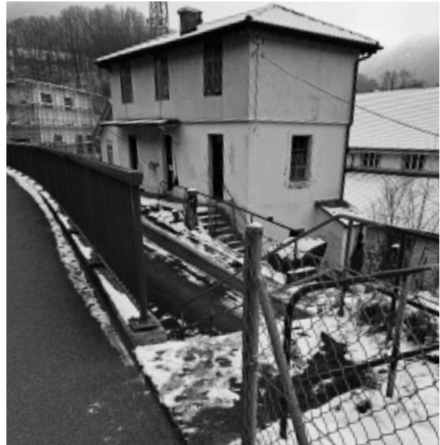
Bei der Büttenen ist kein Durchkommen.

Um die Realisierung zu prüfen und die Problemstellen zu identifizieren, machten sich die beiden Geschäftsstellenleiterinnen und zwei Gemeinderäte aus Grellingen bei eisiger Kälte auf die Tour und suchten Möglichkeiten, einen Wanderweg direkt am Ufer der Birs zwischen Ost-Portal Eggflue-Tunnel und Laufen zu finden. Leider musste das Birsufer mehrmals verlassen und auf stark befahrene Strassen, stützige Umwege und Privatgelände ausgewichen werden oder wegen des Bahntrasses nach dem Chessiloch ein längerer Weg bis zur Bahnunterführung an die Birs zurückgelegt werden. Diese Hindernisse wurden dokumentiert, mögliche