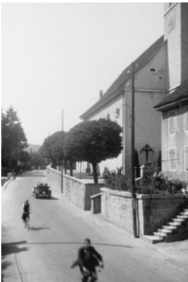
Grellinger Hauptstrasse dorfauswärts um 1920, Mergelstrasse ohne Troittoirs.