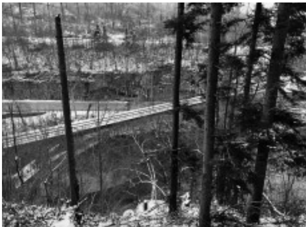
Das Viadukt schneidet den Weg zur Birs ab!

Der Verein Birsstadt unterhält seit 2014 einen Wanderweg vom Birschöpfli bis zum Schloss Angenstein. Dieser Weg führt, wie es der Name bereits besagt, dem Birsufer entlang. Dabei sind nur wenige Streckenteile nicht direkt am Ufer und bilden somit eine wunderbare Landschaft. Auf 11 Thementafeln wird über die Natur und den Menschen an der Birs informiert. Stationen wie «Trinkwasserlieferantin» in Aesch, «Wasserkraftspenderin» in Münchenstein, «Lebensraum des Bibers» in Dornach oder «Lebensader des Naturschutzgebiets» Reinacher Heide.