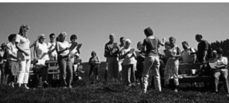
Reise ins Heidiland, 2008